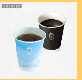
MACHI cafeドリンク(s) 2ヶ